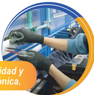
Electricidad y Electrónica.