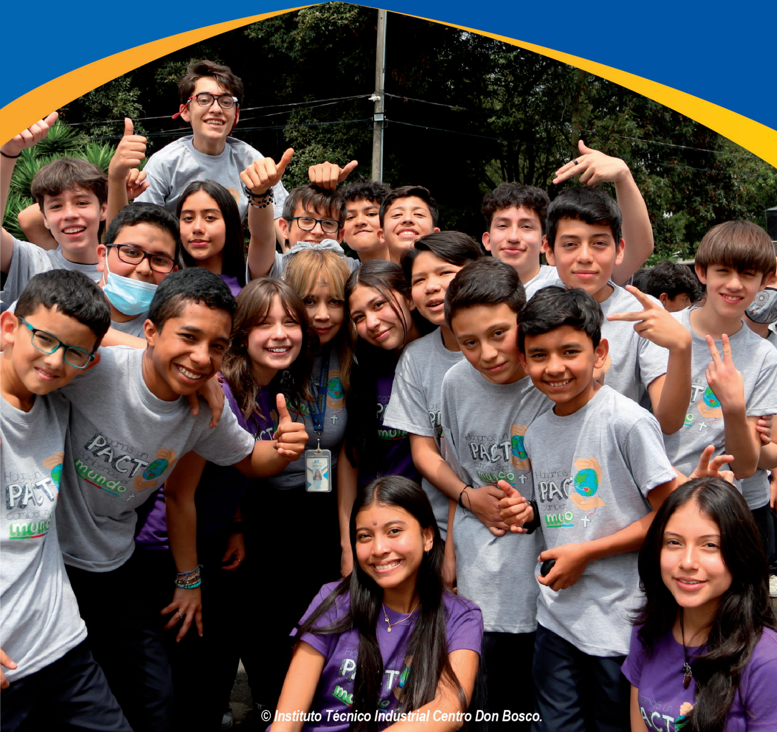
© Instituto Técnico Industrial Centro Don Bosco.